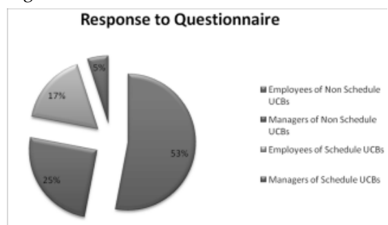
Fig. 2. Response for questionnaire from different UCBs in Nagpur region

In Figure can see that on the questionnaire responded by 53% Employees of Non Schedule UCBs, 25% Managers of Non Schedule UCBs, 17% Employees of Schedule UCBs and 5% managers of Non Schedule UCBs in Nagpur region.